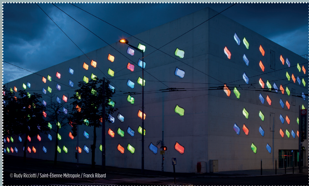
© Rudy Ricciotti / Saint-Étienne Métropole / Franck Ribard